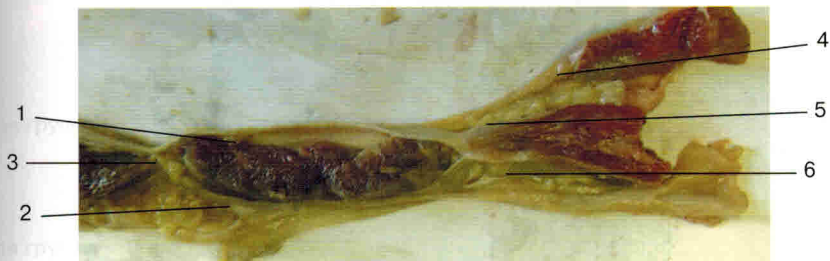
Рис. 5. Формирование влагалища прямой мышцы живота ниже дугообразной линии: 1 — передняя стенка влагалища прямой мышцы живота; 2 — задняя стенка влагалища прямой мышцы живота (брюшина поперечная фасция); 3 — белая линия живота; 4 — апоневроз наружной косой мышцы живота; 5 — апоневроз внутренней косой мышцы живота; 6 — апоневроз поперечной мышцы живота