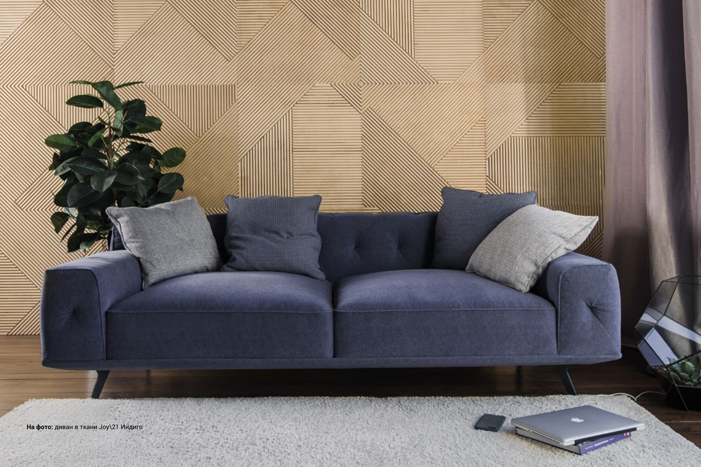
На фото: диван в ткани Joy\21 Индиго