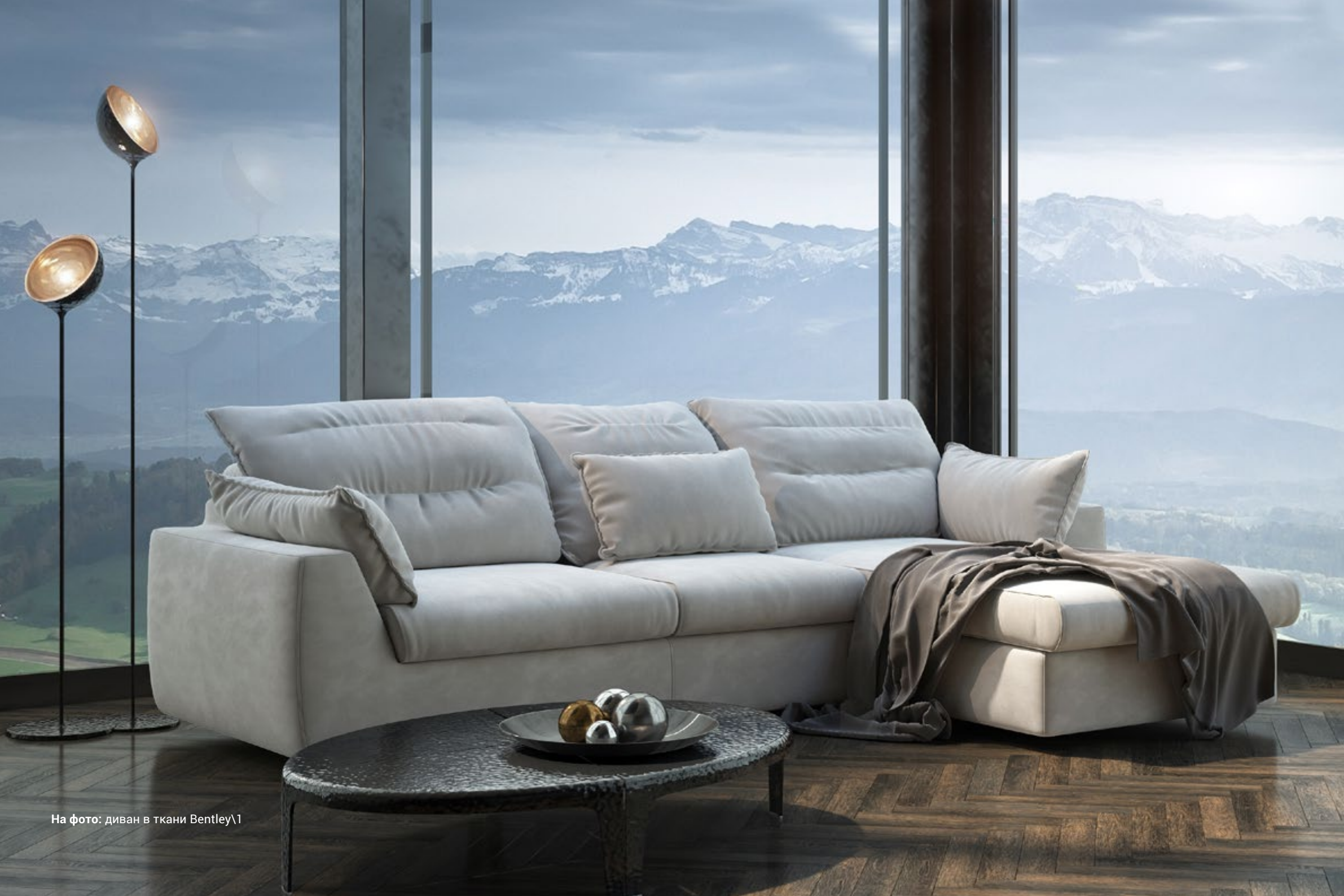
На фото: диван в ткани Bentley\1