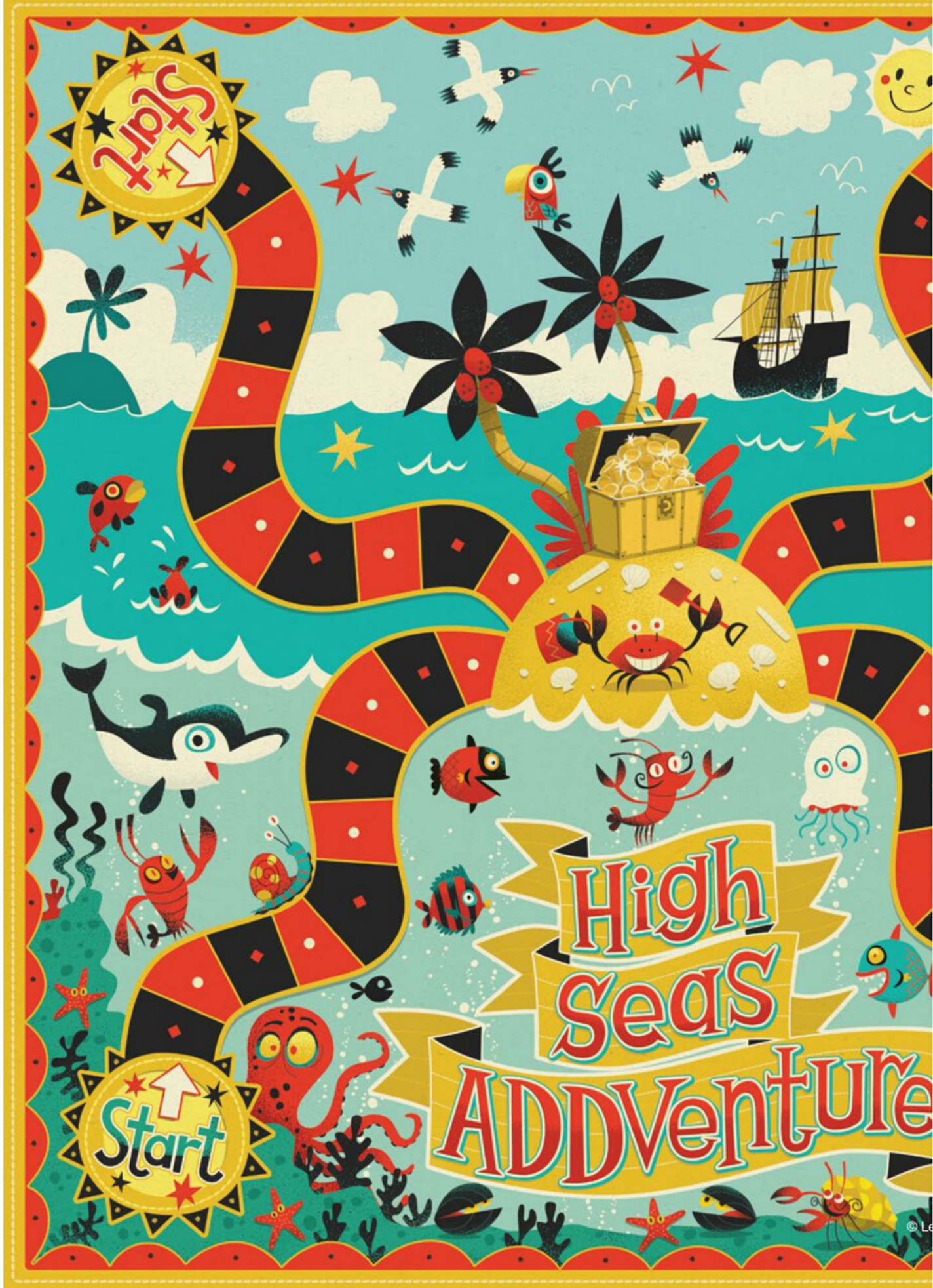
Игровая карта ч.1