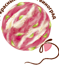
Йогурт красный и белый виноград