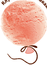
Клубника со сливками