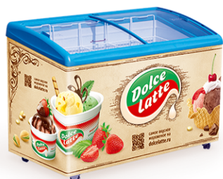
AHT Rio S 125 / ITALFROST 400 C