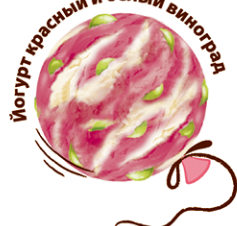
Йогурт красный и белый виноград