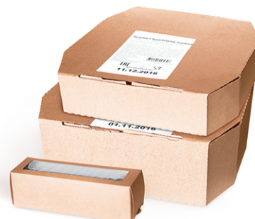
Замороженные десерты (торты, пирожные)