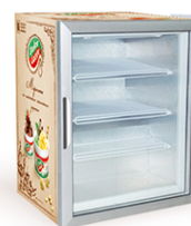
Forcool SD 100 G