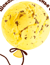
Шоколадное печенье Оreo