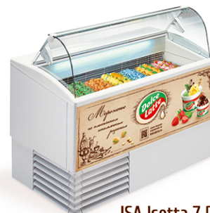
ISA Isetta 7 R