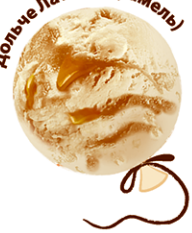
Дольче Латте (карамель)