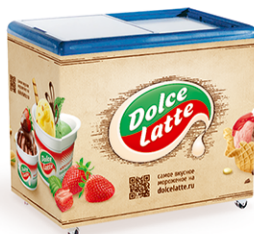
AHT Rio H 100