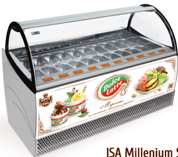
ISA Millenium SP