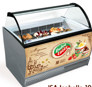
ISA Isabella 10 LX