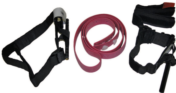
Рис. 3. Жгуты кровоостанавливающие

а — вскрытие наружного чехла по надрезу; б — извлечение внутренней упаковки; в — перевязочный материал в развернутом виде (1 — конец бинта; 2 — подушечка неподвижная; 3 — цветные нитки; 4 — подушечка подвижная; 5 — бинт; 6 — скатка бинта)