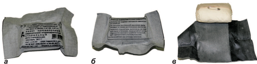
Рис. 1. Пакет перевязочный индивидуальный медицинский стерильный:

Пакет перевязочный медицинский индивидуальный стерильный ППИ предназначен для наложения первичной асептической повязки на рану или ожоговую поверхность, временной остановки наружного кровотечения, устранения открытого пневмоторакса (рис. 1).