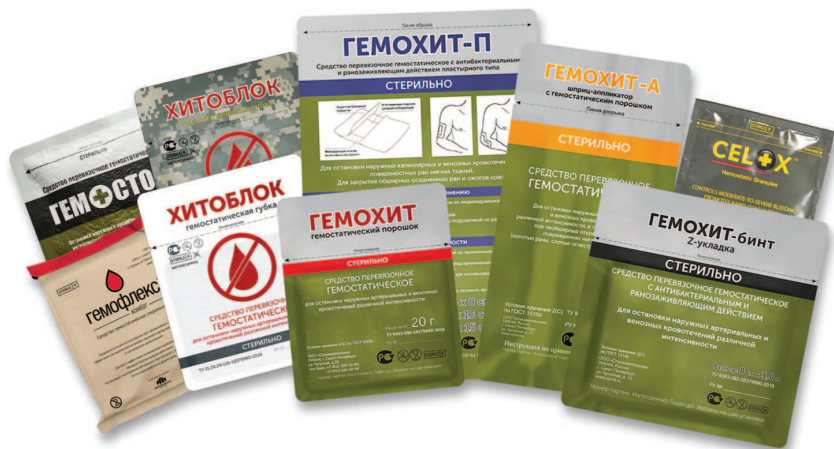
Рис. 4. Местные гемостатические средства

Современные местные гемостатические средства выпускаются в четырех различных вариантах: порошок, бинт (в рулонном виде или в виде z-укладки), аппликатор и пластырь. В военное время применяются при оказании первой помощи в порядке само- и взаимопомощи, а также медицинским персоналом на этапах медицинской эвакуации при оказании доврачебной, первой врачебной и квалифицированной медицинской помощи. В мирное время применяются для оказания первой помощи при ранах, травмах и ожогах, а также медицинским персоналом при оказании первичной медико-санитарной помощи и скорой, в том числе скорой специализированной, медицинской помощи. Кроме того, они могут применяться в условиях медицинского стационара — для остановки кровотечения, лечения ран и ожогов кожи.