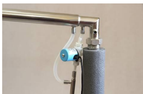
Фото Установка клапана отбора

Клапан старт/стопа по отбору спирта в данном режиме используется по линии отбора продукта из колонны, и может быть включен перед холодильником (между регулятором отбора и холодильником продукта).