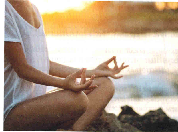
Рис. 5.2. Представление «Дыхание силы»

Эта техника поможет вам подключить свои внутренние ресурсы для решения проблемных ситуаций и использовать внутренние ресурсы для достижения своих целей (рис. 5.2).