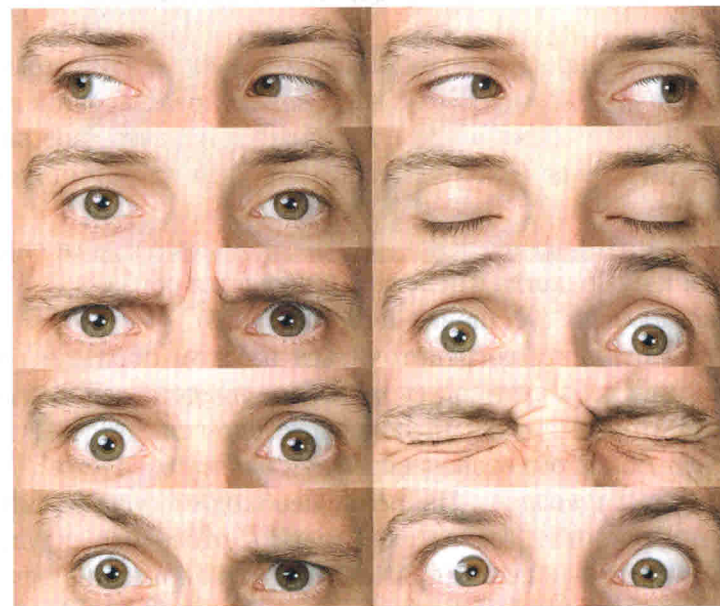
Рис. 5.1. Как прочесть мысли и чувства человека по движению глаз?