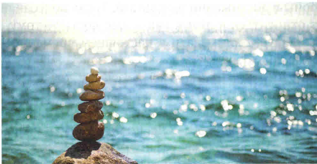
Рис. 5.5. Представление «Саморегуляция внутреннего состояния»

В настоящее время очень популярна регуляция психического состояния с помощью НЛП. Самочувствие и состояние человека имеют предел ресурсов психического здоровья. Чтобы весь год эффективно жить, необходимо мудро тратить свою психическую энергию и знать, как ее можно восполнять, восстанавливать. Человек, знающий себя, свои потребности и способы их удовлетворения, может более осознанно и эффективно распределять свои силы в течение каждого дня, недели, месяца и целого учебного года (рис. 5.5.).